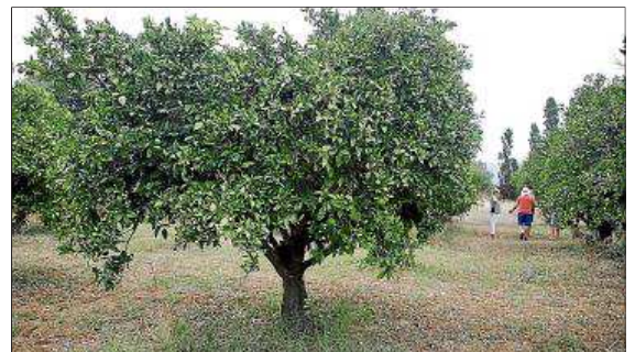
La finca de Fortuny cuenta con más de 150 árboles frutales.