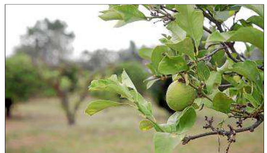
El Parc Agrari Nord apuesta por la agricultura ecológica.