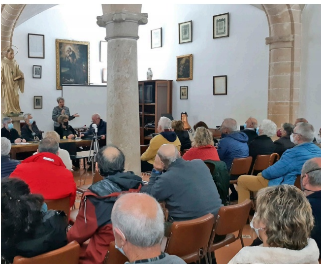
Taula rodona organitzada per la Comunitat de regants de la Síquia d'en Baster i Palma XXI, a les dependències de la Real.