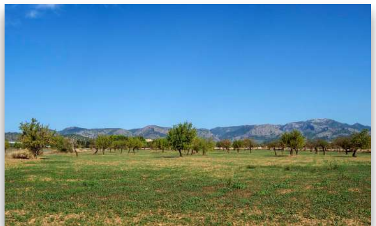
Presentació del PGOU (web Ajuntament), saturació turística al centre de Palma (Ara Balears), pis en lloguer al centre (Maria Reyero) i Parc Agrari de Palma (Jaume Gual).