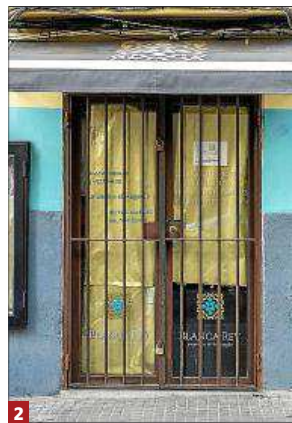
1 y 2 Carbonería. En 1987 una carbonería sobrevivía en Sant Magí, recuerdo de épocas pasadas. En 2018 el local, ya cerrado, era una inmobiliaria y estudio de decoración.