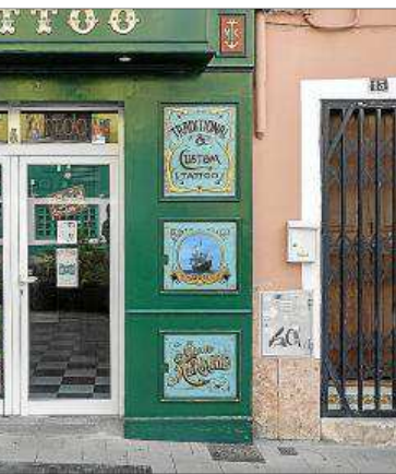
3 y 4 Barbería. A la izqda, en 1987 la calle Cotoner contaba con una barbería de fachada tradicional. En la actualidad se dedica al tatuaje.