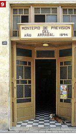
9 y 10 Montepío Arrabal. El que fuera lugar de reunión más emblemático de la zona ha dado lugar a un conocido restaurante

«La calle Fábrica parece un parque temático y el barrio de Santa Catalina ha pasado a ser un polígono de ocio nocturno», se lamenta este antiguo vecino de la barriada. El fotógrafo advierte que «si se viaja a otras ciudades, hay diseños similares. Son franquicias y sucursales bancarias. Estas fachadas antiguas de Santa Catalina eran singulares porque obedecían al gusto personal de cada comerciante». Mientras