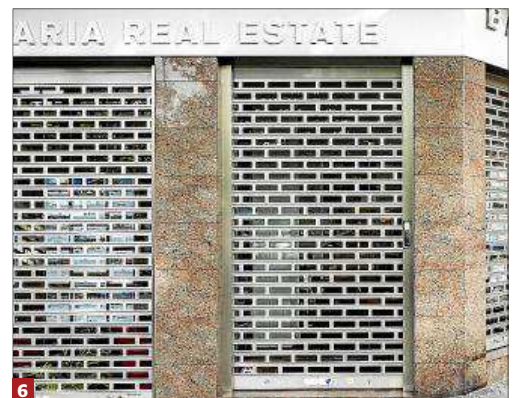
5 y 6 Peluquería. Arriba, una antigua peluquería en Avenida Argentina. En la foto de abajo, tras el derribo del edificio se construyó uno nuevo y se instaló una inmobiliaria.

ra impartir una conferencia sobre la gentrificación comercial de Palma intensificada por la inversión extranjera y el turismo urbano.